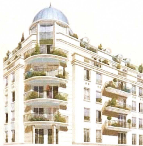
Investissement PERL en nue-proprieté